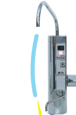
Nước ion axit pH 5.5

Nước ion axit (Acidic) (vòi trên): rửa mặt, làm mát, xả tóc. Giúp da se khít, săn chắc và dưỡng ẩm. Giúp tóc bóng mượt. Không được uống.