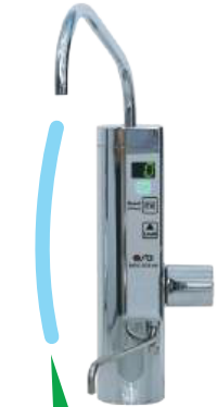
Nước lọc pH 7.0