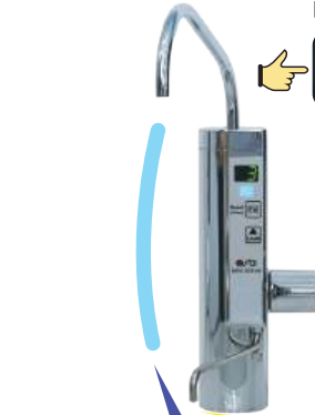
Nước ion kiềm pH 8.5 - 9.5

Nước ion kiềm (Alkaline 1,2,3) (vòi trên): nước uống hàng ngày, rất tốt cho sức khỏe. Có thể dùng để nấu ăn và pha chế đồ uống.