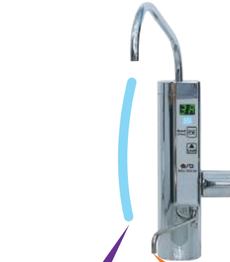
Nước ion kiềm pH 10.0

Nước ion kiềm mạnh (Strong Alkaline) (vòi trên): rửa rau, củ, trái cây, vo gạo. Không được uống.